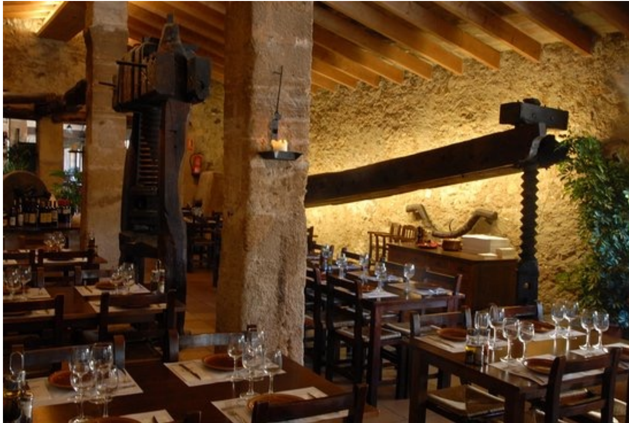
Torre de Canyamel. Restaurant