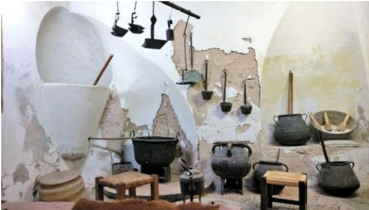
Museu de Muro