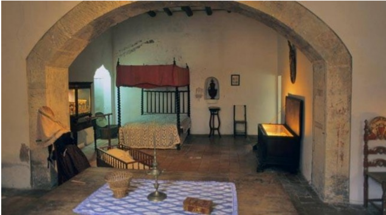
Museu de Muro