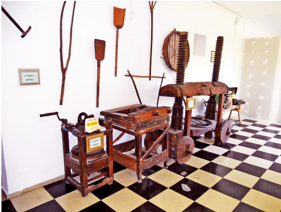
Museu de la Porciúncula