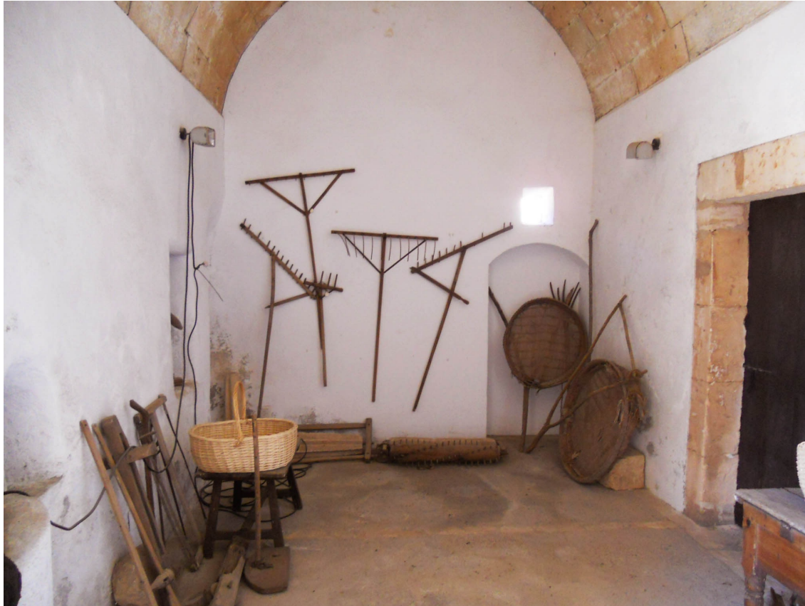
Molí d'en Gaspar